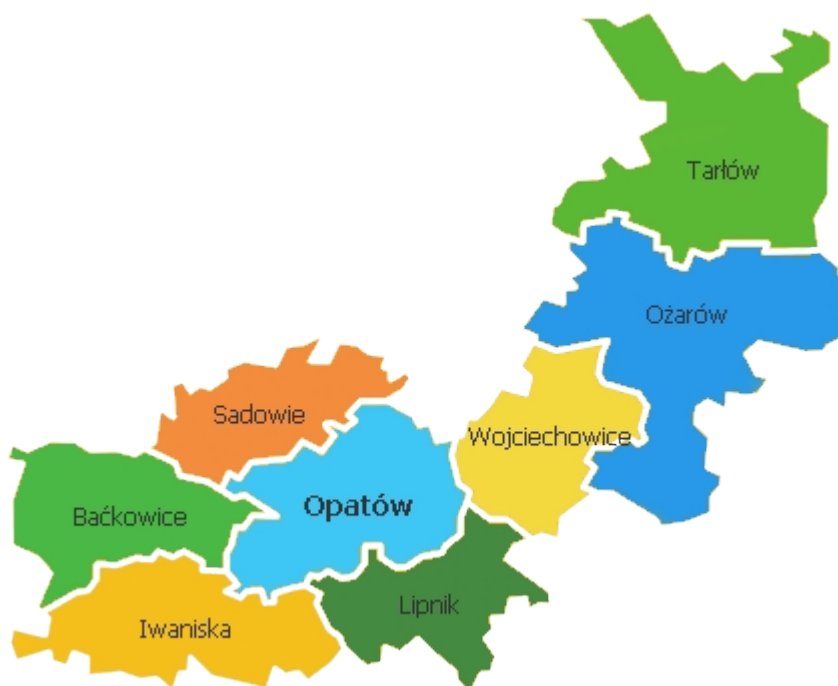
Rys. Gminy powiatu opatowskiego

Powiat opatowski obejmuje trzy gminy miejsko-wiejskie: Opatów, Ożarów, Iwaniska, oraz pięć gmin wiejskich: Baćkowice, Lipnik, Sadowie, Tarłów, Wojciechowice.